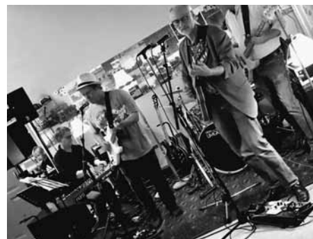
Odder Byorkester fik mange ud på dansegulvet i løbet af aftenen

Der sker noget i Boulstrup i disse måneder. Den 29. september arrangerede initiativrige mennesker fra Boulstrup Lokalråd en meget fin høstfest i Forsamlingshuset. Det var en stor succes med ikke mindre end 67 deltagere – børn og voksne. Aftenen startede med fællesspisning af egen medbragt mad, og snakken gik lystigt rundt omkring ved bordene.