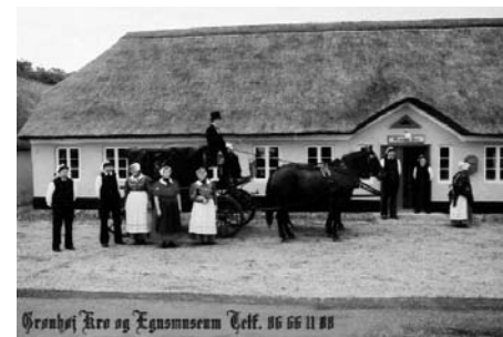
Grønhøj Kro og Egnsmuseum Telf. 86 66 11 88

Efter middagen er det tid til at se Morten Korch Museet, hvorefter vi kører til Kongenshus Mindepark. Kaffen indtages på Grønhøj Kro, før turen igen går hjemad.